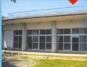
神集島 上陸 約10分