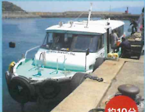
定期船 からつ丸 約10分